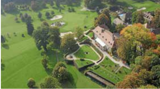
BONMONT 17 septembre