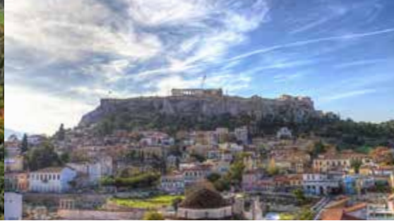
ATHÈNES 07-09 octobre