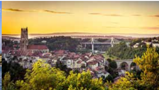
FRIBOURG 12 novembre