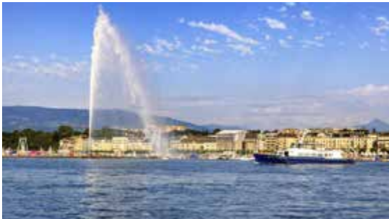
GENÈVE 29 octobre